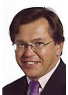
Dr. Libor Rouček