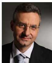
Ing. Jan Zahradil