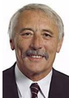
JUDr. Richard Falbr

E-mail: dusekr@psp.cz , rdusek@centrum.cz